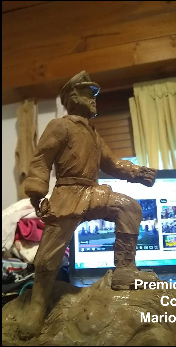
Premio/Distinción Comodoro Mario Luis Olesa