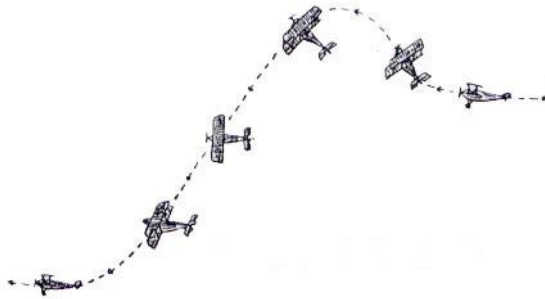
RESBALAMIENTO DE ALA

Para expresarlo con exactitud, la máquina no se deslizaba realmente hacia atrás sobre la cola, sino que se le dejaba caer la cabeza y hacía un descenso casi vertical, mientras el enemigo pasaba por encima. El piloto de la primera máquina, de acuerdo con las circunstancias, quedaba en libertad de continuar el deslizamiento y escapar hacia tierra; o de enderezar y convertirse en perseguidor y atacante.